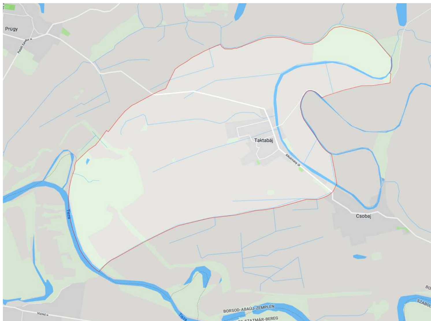
Átnézeti térkép teljes közigazgatási terület